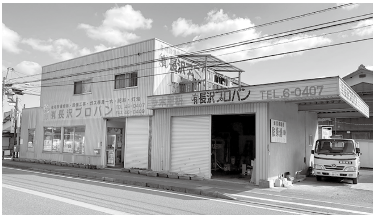
大分・佐伯市の長沢プロパン本社